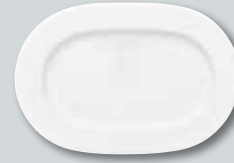
OCR-Nr. 16-3272-3570 200 x 140 mm · 8 x 5 ½ in. Oval pickle dish · Ravier ovale Beilagenschale oval · Rabanera ovalada Raviera ovale