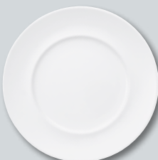
OCR-Nr. 16-3272-2796 Ø 290 mm · 11 ¼ in. Flat plate · Assiette plate · Teller flach Plato llano · Piatto piano (inner well · intérieur · innen · interior · all'interno Ø 180 mm · 7 in.)