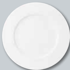
OCR-Nr. 16-3272-2680 Ø 300 mm · 12 in. Buffet plate · Assiette d'accueil · Platzteller Plato presentación · Piatto segnaposto