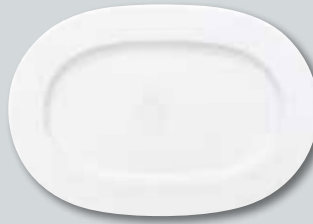
OCR-Nr. 16-3272-2940 410 x 290 mm · 16 ¼ x 11 ¼ in. Oval plate · Assiette ovale · Teller oval Fuente ovalada · Piatto ovale OCR-Nr. 16-3272-2960 340 x 230 mm · 13 ¼ x 9 in.