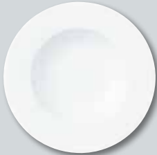
OCR-Nr. 16-3272-2790 Ø 290 mm · 11 ¼ in. Deep plate · Assiette creuse · Teller tief Plato hondo · Piatto fondo OCR-Nr. 16-3272-2700 Ø 240 mm · 9 ½ in.