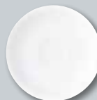
OCR-Nr. 16-3272-1310 Ø 150 mm · 6 in. Saucer · Soucoupe · Untere · Plato para taza Piattino tazza (Cup, Tasse, Tasse, Taza, Tazza OCR-Nr. -1270, -1300)