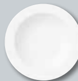
OCR-Nr. 16-3272-3821 Ø 200 mm · 8 in. Salad dish · Assiette calotte · Salatschale Plato hondo · Insalatiera