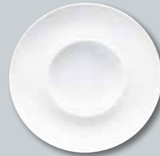
OCR-Nr. 16-3272-2701 Ø 290 mm · 11 ¼ in. Deep plate · Assiette creuse · Teller tief Plato hondo · Piatto fondo (inner well · intérieur · innen · interior · all'interno Ø 140 mm · 5 ½ in.)