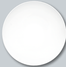
OCR-Nr. 16-3272-2595 Ø 330 mm · 13 in. Flat coupe plate · Assiette coupe plate Coupeteller flach · Plato coupe llano Piatto coupe piano OCR-Nr. 16-3272-2601 Ø 290 mm · 11 ¼ in. OCR-Nr. 16-3272-2641* Ø 250 mm · 10 in. OCR-Nr. 16-3272-2651 Ø 210 mm · 8 ¼ in. OCR-Nr. 16-3272-2661 Ø 160 mm · 6 ¼ in.