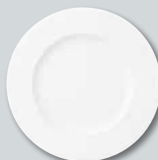
OCR-Nr. 16-3272-2600 Ø 290 mm · 11 ¼ in. Flat plate · Assiette plate · Teller flach Plato llano · Piatto piano OCR-Nr. 16-3272-2630 Ø 280 mm · 11 in. OCR-Nr. 16-3272-2640 Ø 240 mm · 9 ½ in. OCR-Nr. 16-3272-2650 Ø 220 mm · 9 in. OCR-Nr. 16-3272-2660 Ø 160 mm · 6 ¼ in.