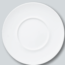
OCR-Nr. 16-3272-2795 Ø 290 mm · 11 ¼ in. Flat plate · Assiette plate · Teller flach Plato llano · Piatto piano (inner well · intérieur · innen · interior · all'interno Ø 140 mm · 5 ½ in.)