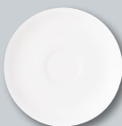
OCR-Nr. 16-3272-2520 Ø 175 mm · 6 ¾ in. (Soup cup, Tasse bouillon, Bouillontasse, Taza consomé, Tazza da brodo OCR-Nr. -2510)