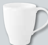
OCR-Nr. 16-3293-9651 0,40 l · 13 ½ ozs. Mug with handle · Chope avec anse Becher mit Henkel · Jarra con asa Bicchiere con manico