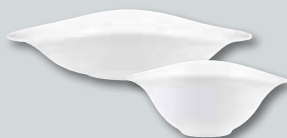
OCR-Nr. 16-3293-3865 310 x 240 mm · 12 ¼ x 9 ½ in. Deep bowl · Coupe creuse · Schale tief Copa honda · Coppa fonda OCR-Nr. 16-3293-3866 270 x 210 mm · 10 ½ x 8 ¼ in. OCR-Nr. 16-3293-3867 210 x 170 mm · 8 ¼ x 7 in.