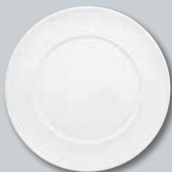
OCR-Nr. 16-3293-2590 Ø 320 mm · 12 ½ in. Flat plate · Assiette plate · Teller flach Plato llano · Piatto piano