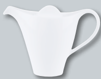
OCR-Nr. 16-3293-0220 0,30 l · 10 ¼ ozs. Coffeepot · Cafetière · Kaffeekanne Cafetera · Caffettiera