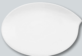
OCR-Nr. 10-3420-2960 360 x 240 mm · 14 1 / 4 x 9 1 / 2 in. Oval platter · Plat ovale · Platte ovale Plato ovalado · Piatto ovale