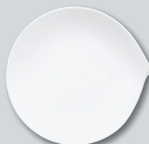
OCR-Nr. 10-3420-2620 280 x 270 mm · 11 x 10 1 / 2 in. Flat plate · Assiette plate · Teller flach Plato llano · Piatto piano