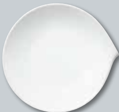
OCR-Nr. 10-3420-2775 310 x 290 mm · 12 1 / 4 x 11 1 / 4 in. Gourmet plate · Assiette gourmet Gourmetteller · Plato gourmet · Piatto gourmet