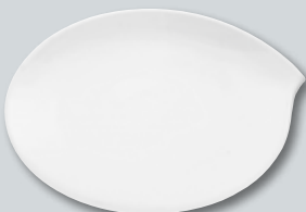
OCR-Nr. 10-3420-2960 360 x 240 mm · 14 1 / 4 x 9 1 / 2 in. Oval platter · Plat ovale · Platte ovale Plato ovalado · Piatto ovale