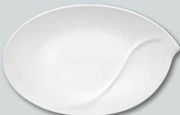
OCR-Nr. 10-3420-2940 470 mm x 290 · 18 1 / 2 x 11 1 / 4 in. Oval platter · Plat ovale · Platte ovale Plato ovalado · Piatto ovale