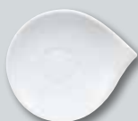
OCR-Nr. 10-3420-1310 180 x 150 mm · 7 x 6 in. Saucer · Soucoupe · Untere · Plato para taza Piattino tazza (Cup, Tasse, Tasse, Taza, Tazza OCR-Nr. -1300 Mug with handle, Chope avec anse, Becher mit Henkel, Jarra con asa, Bicchiere con manico OCR-Nr. -9651)