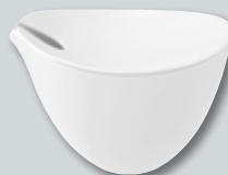
OCR-Nr. 10-3420-3070 3,0 l · 105 ozs. Covered bowl · Bol · Schale mit Deckel Fuente · Coppa