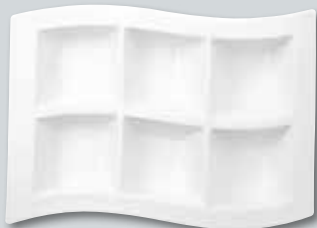
OCR-Nr. 10-2525-3500 410 x 300 mm · 16 ¼ x 11 ¾ in. Platter 6 compart. · Plat 6 compart. Kabarett 6 Fach · Fuente 6 comparti. Vassoio 6 sez.