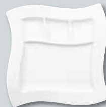
OCR-Nr. 10-2525-2855 270 x 270 mm · 10 ½ x 10 ½ in. Grill plate · Assiette Grill · Grillplatte Plato Grill · Piatto Grill