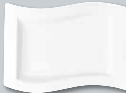
OCR-Nr. 10-2525-2699 330 x 240 mm · 12 ¾ x 9 ½ in. Rectangular plate · Assiette rectangulaire Teller rechteckig · Plato rectangular Piatto rettangolare