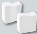
OCR-Nr. 10-2525-3470 70 x 40 mm · 2 ¾ x 1 ⅝ in. Saltshaker · Salière · Salzstreuer · Salero Spargisale OCR-Nr. 10-2525-3480 70 x 40 mm · 2 ¾ x 1 ⅝ in. Peppershaker · Poivrier · Pfefferstreuer Pimentero · Spargipepe