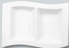
OCR-Nr. 10-2525-3510 310 x 210 mm · 12 ¼ x 8 ¼ in. Platter 2 compart. · Plat 2 compart. Kabarett 2 Fach · Fuente 2 comparti. Vassoio 2 sez.