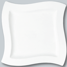
OCR-Nr. 10-2525-2809 340 x 340 mm · 13 ¼ x 13 ¼ in. Square plate · Assiette plate carrée Fuente cuadrada · Piatto quadrato