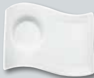
OCR-Nr. 10-2484-2830 220 x 170 mm · 8 ½ x 6 ¾ in. Partyplate (Cup, Tasse, Tasse, Taza, Tazza OCR-Nr. -1210, -1330, -9651)