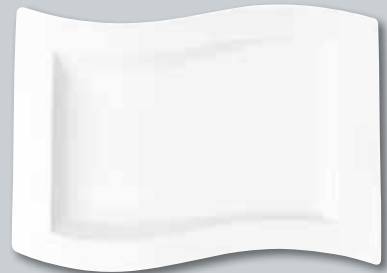
OCR-Nr. 10-2525-2281 490 x 300 mm · 19 ¼ x 11 ¾ in. Rectangular platter · Plat rectangulaire Platte rechteckig · Fuente rectangular Piatto grande rettangolare