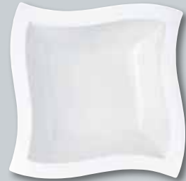
OCR-Nr. 10-2525-3320 330 x 330 mm · 13 x 13 in. Salad bowl · Saladier · Salatschale Ensaladera · Insalatiera OCR-Nr. 10-2525-3330 250 x 250 mm · 10 x 10 in.