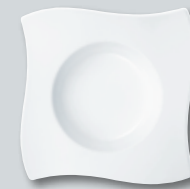
OCR-Nr. 10-2525-2709 240 x 240 mm · 9 ½ x 9 ½ in. Deep plate · Assiette creuse · Teller tief Plato hondo · Piatto fondo

Subject to change · Modifications possibles · Änderungen vorbehalten · Salvo error · Con riserva di modifica