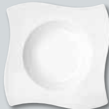
OCR-Nr. 10-2525-2698 280 x 280 mm · 11 x 11 in. Pasta plate · Assiette à pâtes · Pastateller Plato pasta · Piatto pasta