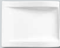
OCR-Nr. 10-2525-2646 260 x 200 mm · 10 ¼ x 7 ⅞ in. Flat rectangular plate · Assiette plate rectangulaire Teller flach, rechteckig · Plato llano rectangular Piatto piano rettangolare