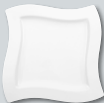
OCR-Nr. 10-2525-2619 270 x 270 mm · 10 ½ x 10 ½ in. Flat square plate · Assiette plate carrée Teller flach, quadratisch · Plato hondo cuadrado Piatto piano quadrato