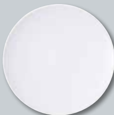
OCR-Nr. 16-3356-2621 Ø 290 mm · 11 ¼ in. Flat coupe plate · Assiette coupe plate Coupeteller flach · Plato coupe llano Piatto coupe piano