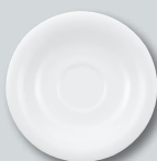
OCR-Nr. 16-3356-1280 Ø 160 mm · 6 ¼ in. Saucer · Soucoupe tasse · Untertasse Platillo para taza · Piattino tazza (Cup, Tasse, Tasse, Taza, Tazza OCR-Nr. -1270, -1271, -1360, -1361)