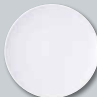
OCR-Nr. 16-3356-2631 Ø 250 mm · 9 ¾ in. Flat coupe plate · Assiette coupe plate Coupeteller flach · Plato coupe llano Piatto coupe piano