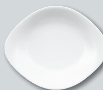
OCR-Nr. 16-3356-2730 260 x 210 mm · 10 ¼ x 8 ¼ in. Oval flat plate · Assiette plate ovale Teller flach, oval · Plato llano ovalado Piatto piano ovale