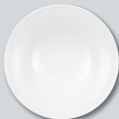
OCR-Nr. 16-3356-2701 Ø 290 mm · 11 ¼ in. 0,27 l · 9 ¼ ozs. Coupe deep plate · Assiette coupe creuse Coupeteller tief · Plato copa hondo Piatto coupe fondo