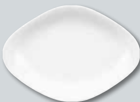
OCR-Nr. 16-3356-2720 360 x 250 mm · 14 x 9 ¾ in. Oval flat plate · Assiette plate ovale Teller flach, oval · Plato llano ovalado Piatto piano ovale