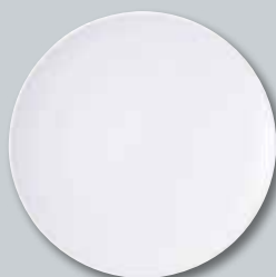
OCR-Nr. 16-3356-2595 Ø 320 mm · 12 ½ in. Flat coupe plate · Assiette coupe plate Coupeteller flach · Plato coupe llano Piatto coupe piano