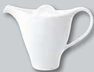
OCR-Nr. 16-3356-0220 0,30 l · 10 ¼ ozs. Coffeepot · Cafetière · Kaffeekanne · Cafetera Caffettiera