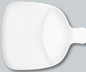
OCR-Nr. 16-4025-1172 370 x 305 mm · 14 ½ x 12 in. Barbecue plate · Ass.a barbecue · Grillteller Plato barbacoa · Piatto barbecue