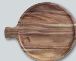
OCR-Nr. 10-4130-8058 350 x 290 mm · 13 ¾ x 11 ¼ in. Antipasti plate · Plat a antipasti · Antipastiplatte Plato aperitivo · Piatto antipasti