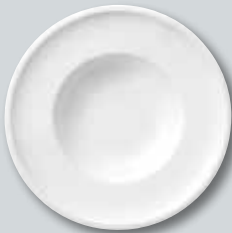
OCR-Nr. 16-4025-2790 Ø 300 mm · 12 in. Deep plate · Assiette creuse Teller tief · Plato hondo · Piatto fondo. OCR-Nr. 16-4025-2700 250 mm · 9 ¾ in.