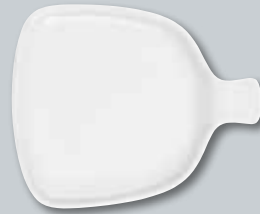
OCR-Nr. 16-4025-1174 330 x 270 mm · 13 x 10 ½ in. Sandwich plate · Assiette d. Sandwich Sandwich Teller · Plato Sandwich · Piatto Sandwich