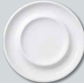
OCR-Nr. 16-4025-3760 370 mm · 14 ½ in. Presentation bowl · Coupe presentation Präsentationsschale · Centro presentacion Coppa presentazione